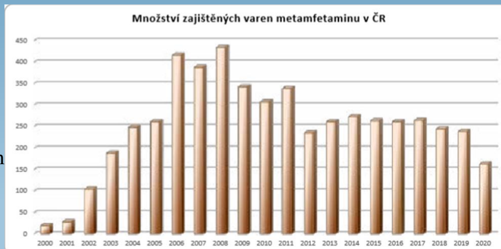
Obr. 2 – Množství zajištěných meth. labs